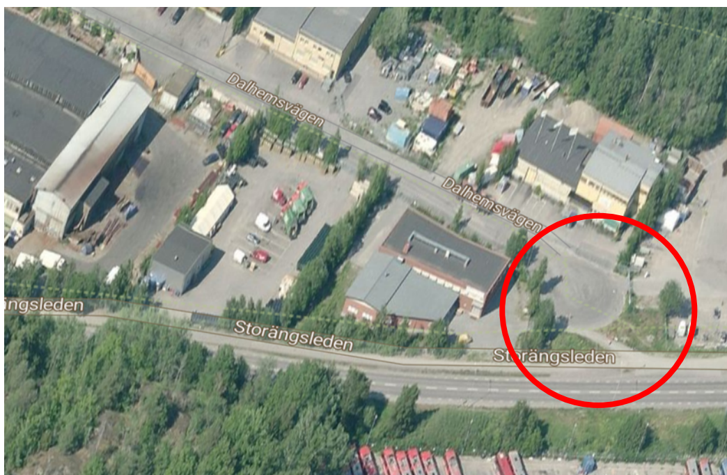
Figur 2, Ortofoto över Storängsleden, väg 259 och Dalhemsvägen där läge för ny korsning är markerat med röd cirkel.